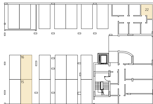
Piso -1 | Parqueamento Nº15 e Nº16 Arrecadação Nº22 - 6,08m 2